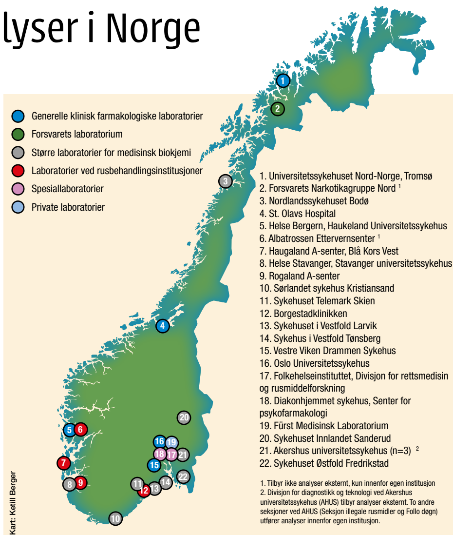
FIGUR 1 Geografisk fordeling av laboratoriene i Norge som tilbyr rusmiddeltesting.